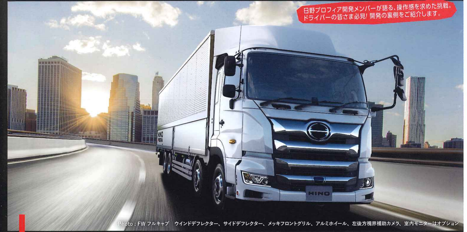
Photo: FW フルキャブ ウインドデフレクター、サイドデフレクター、メッキフロントグリル、アルミホイール、左後方視界補助カメラ、室内モニターはオプション