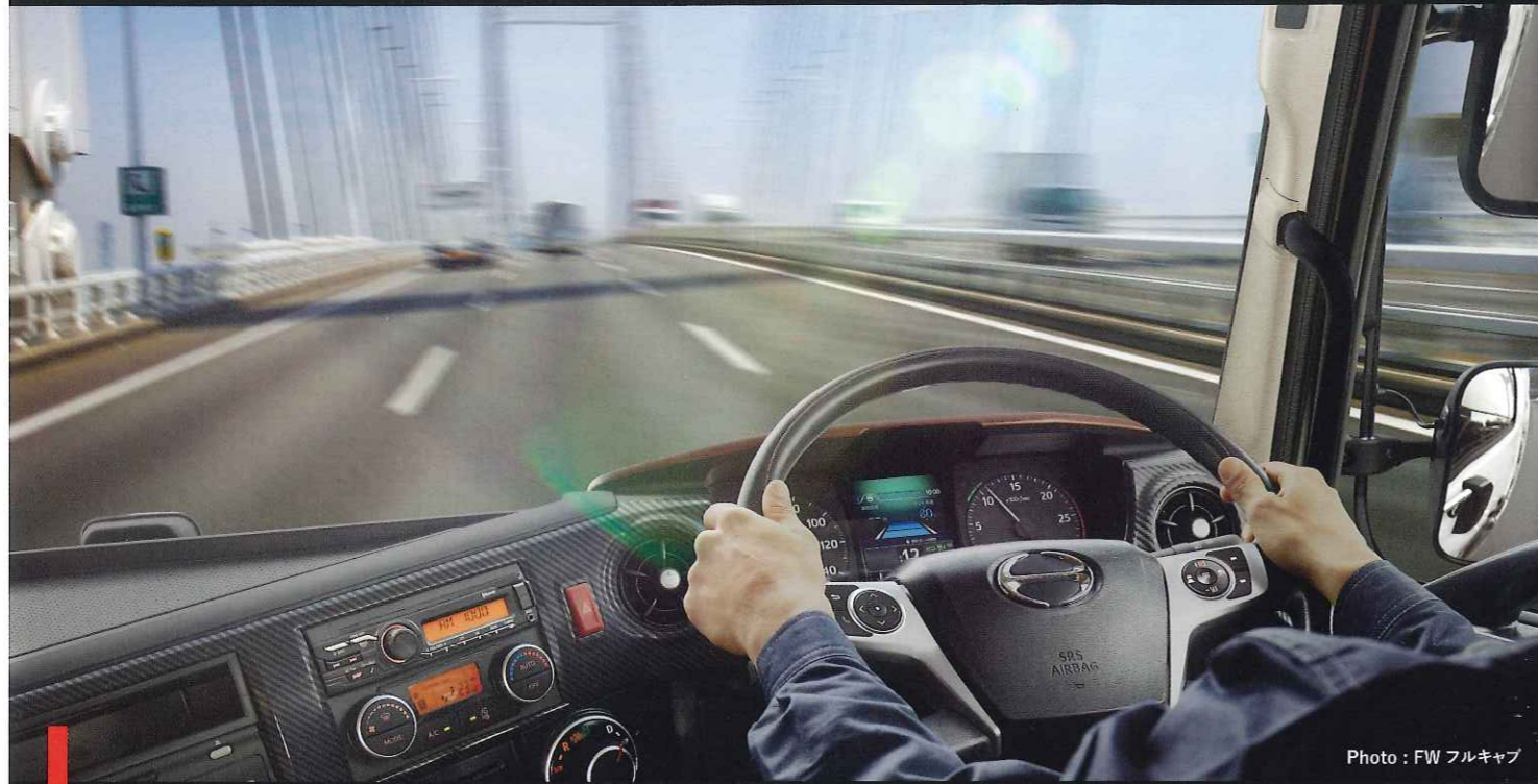
Photo: FW フルキャブ